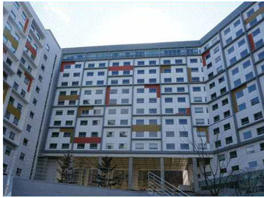
블루미르홀 (308관, 309관)