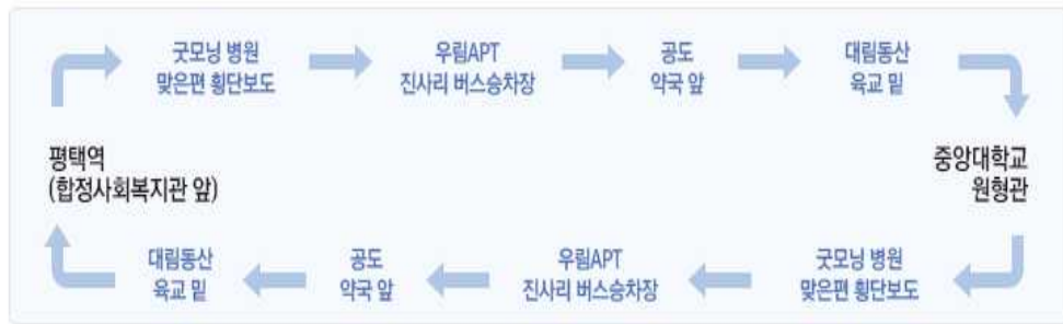
▣ 안성캠퍼스↔평택역 순환버스 안내