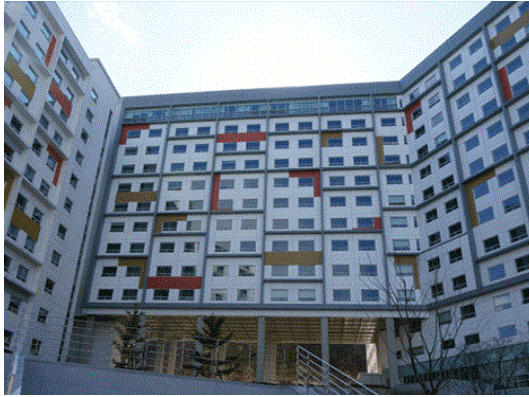
블루미르홀 (308관, 309관)