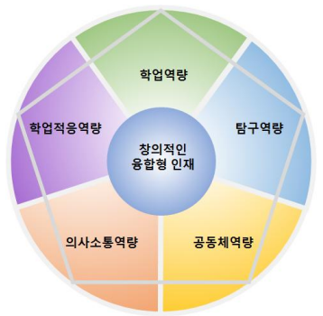
[중앙대학교 펜타곤 평가 모형]