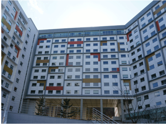
블루미르홀 (308관, 309관)